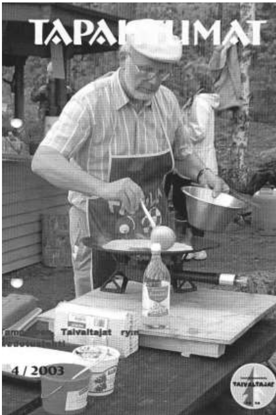
Otto elementissään kesällä 2003.